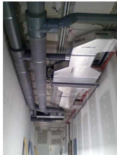
Instalación de climatización de cassette por conductos en Holland & Barret, en Granada.