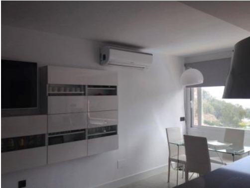
Instalación de Split inverter en vivienda particular