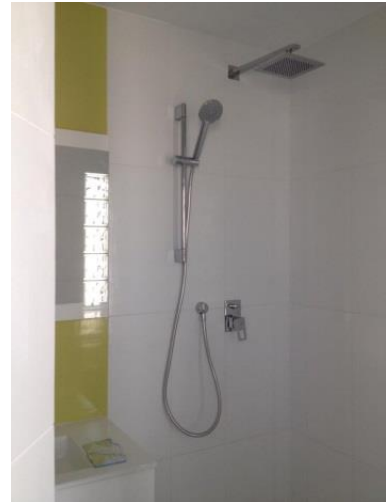
Instalación de sanitarios en vivienda e Instalación de ducha en vivienda