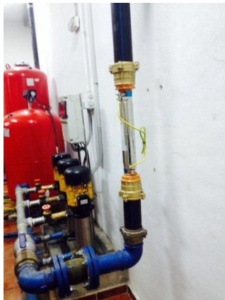
Inhibidor de cal y anticorrosivo para 80 viviendas